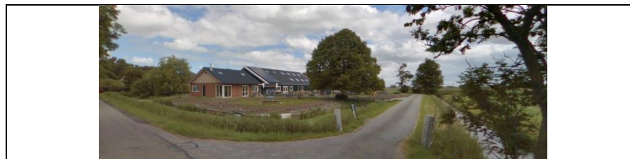
Herbouw boerderij – zonder streekgebonden identiteit.

De nieuwe invullingen en de verstevigde woningen zijn vaak niet meer herkenbaar als streekgebonden architectuur. Ze kunnen even goed in Brabant of in Flevoland staan. Daarmee gaat een groot deel van de identiteit van het gebied verloren.